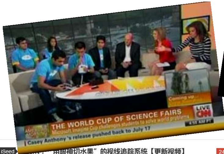
iSeed “用眼神切水果”的视线追踪系统【更新视频】